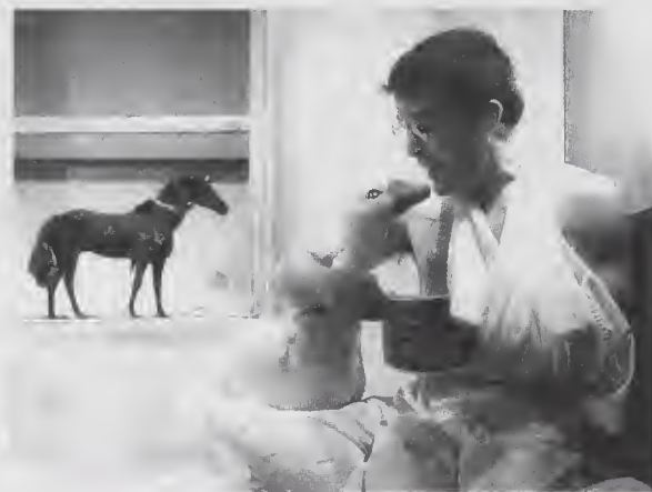
L'Histoire de l'oie

Alternant récit et scènes jouées selon un mode épique, la représentation sera placée sous le signe de l'enfance avec pour accessoires quelques marionnettes et une grande malle à jouets. Ce spectacle ludique fera la part belle à l'imaginaire du conte et au merveilleux.